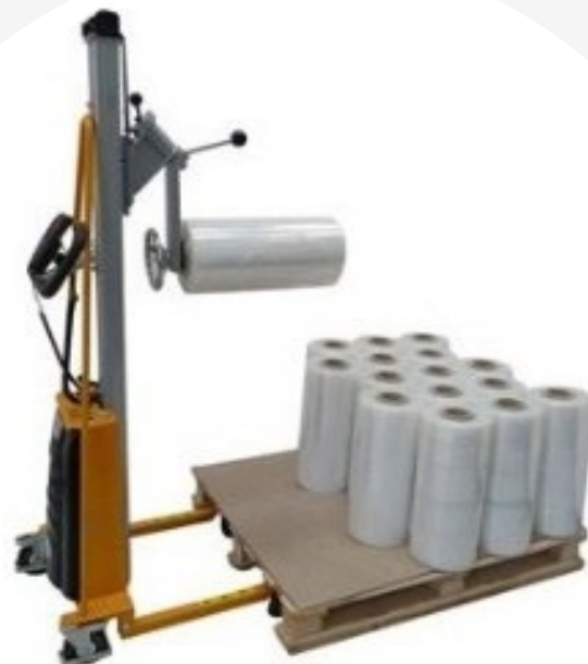
Rotobobine mandrin de 3" Poids maxi 50Kg Ø maxi 550mm Hauteur utile - 300mm