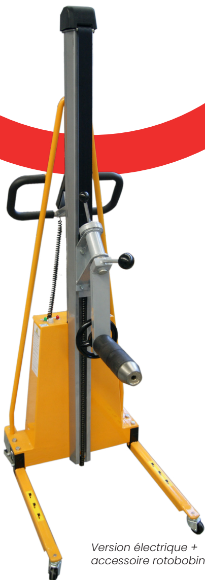
Version électrique + accessoire rotobobine