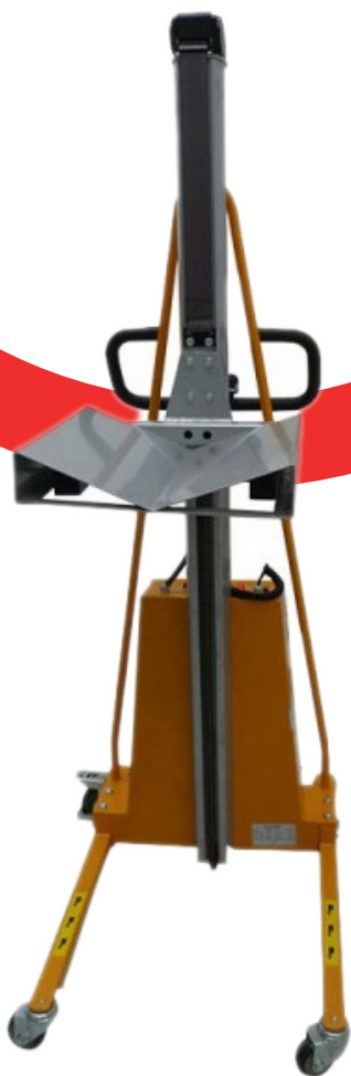
Plateau en V