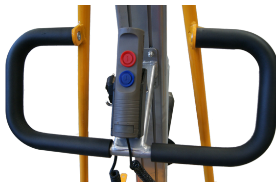
Commande filaire (standard)